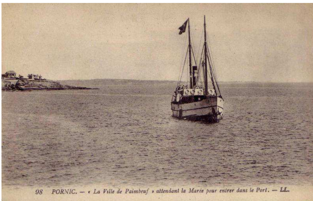
98 PORNIC. — « La Ville de Paimbœuf » attendant la Marée pour entrer dans le Port. — LL.

En Août 1914, étant enseigne de vaisseau de réserve, nommé à Saint-Nazaire au commandement de l'arraisonneur Ville-de-Paimbœuf , réquisitionné dans ce port.